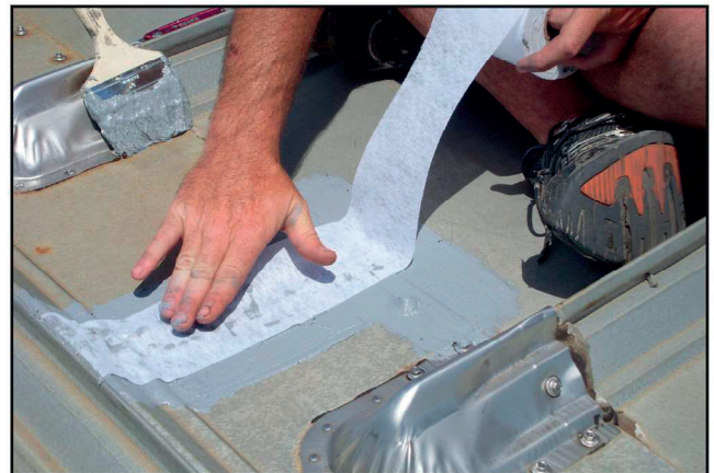
PolyCore™-kalvoa on upotettu Polyprene®-massaan korjauksen vahvistamiseksi. Polyprene® levitetään myös kalvon päälle prosessin loppuun saattamiseksi.