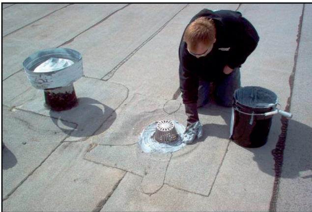
Kattokaivon ympärille käsin levitetty Polyprene® täyttää helposti vettä keräävät kohdat.