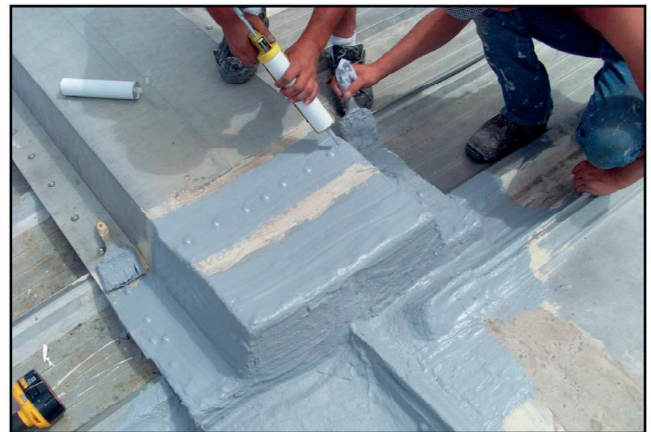
Polyprene® on helppo levittää patruunasta juuri sinne, mihin tarvitsee.