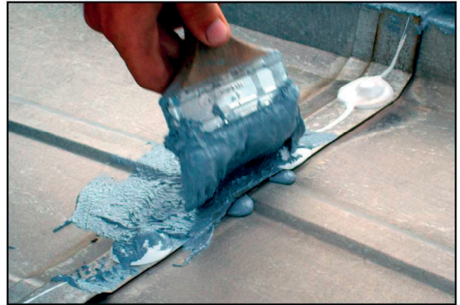
Polyprene®-massaa sivellään sauman päälle sen tiivistämiseksi välittömästi. Huomaa myös metallisauman alle levitetty massa (siveltimen alla).

3 Levitä Polyprene® rakoihin. Levitä massaa kattoikkunoiden, listojen, läpivientien, kattovarusteiden ja kourujen saumojen ympärille. Lastalla tai kumikäsineellä korjaukset sujuvat nopeimmin. Levitä listoille ja vähintään 15 cm reunojen yli kattopinnalle. Täyttääksesi 5 mm suuremmat raot aseta 15 cm:n levyistä PolyCore™-kalvoa (nukkapuoli alaspäin) märkään Polyprene®-massaan. Upota kalvo aina niin, että se on sileä ja rypytön. Pinnoita ja tiivistä kalvon reunat.